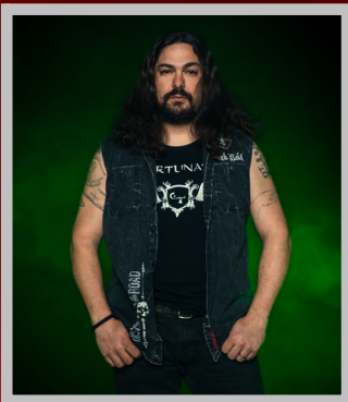
Sly Tale Drums